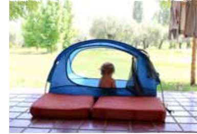
In je bed kun je ook spelen.