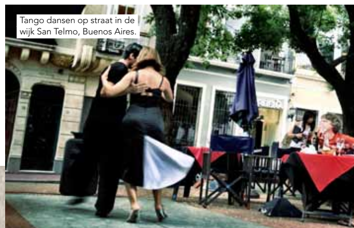
Tango dansen op straat in de wijk San Telmo, Buenos Aires.

door Martine Bruynooge | foto's privébezit