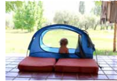
In je bed kun je ook spelen.