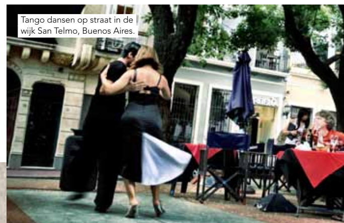
Tango dansen op straat in de wijk San Telmo, Buenos Aires.

door Martine Bruynooge | foto's privébezit