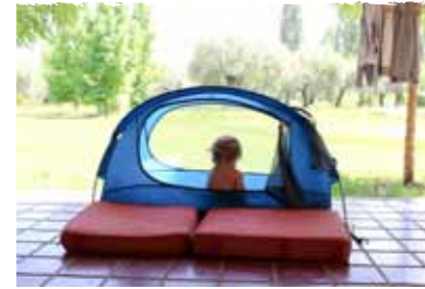
In je bed kun je ook spelen.