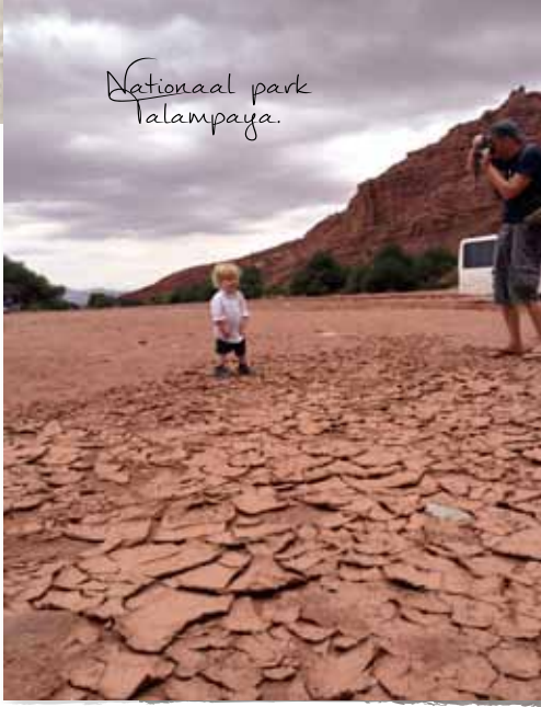
Nationaal park Talamaya.