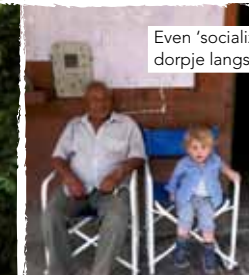
Even 'socializen' in een dorpje langs Route 40.