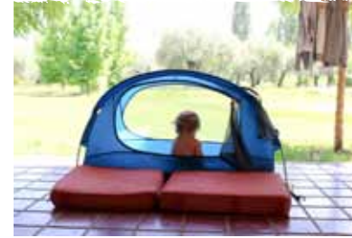
In je bed kun je ook spelen.