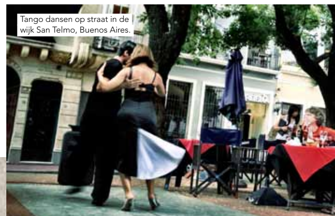
Tango dansen op straat in de wijk San Telmo, Buenos Aires.

door Martine Bruynooge | foto's privébezit